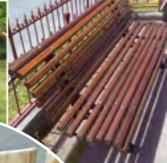
Valos para Parques Galopín SL e outros produtos a medida.

Capacidade de resposta para atender producións seriadas ou encargos individuais para operacións concretas.